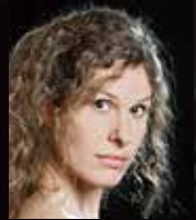
演出: ロッテ・デ・ベア Stage Director: Lotte de Beer