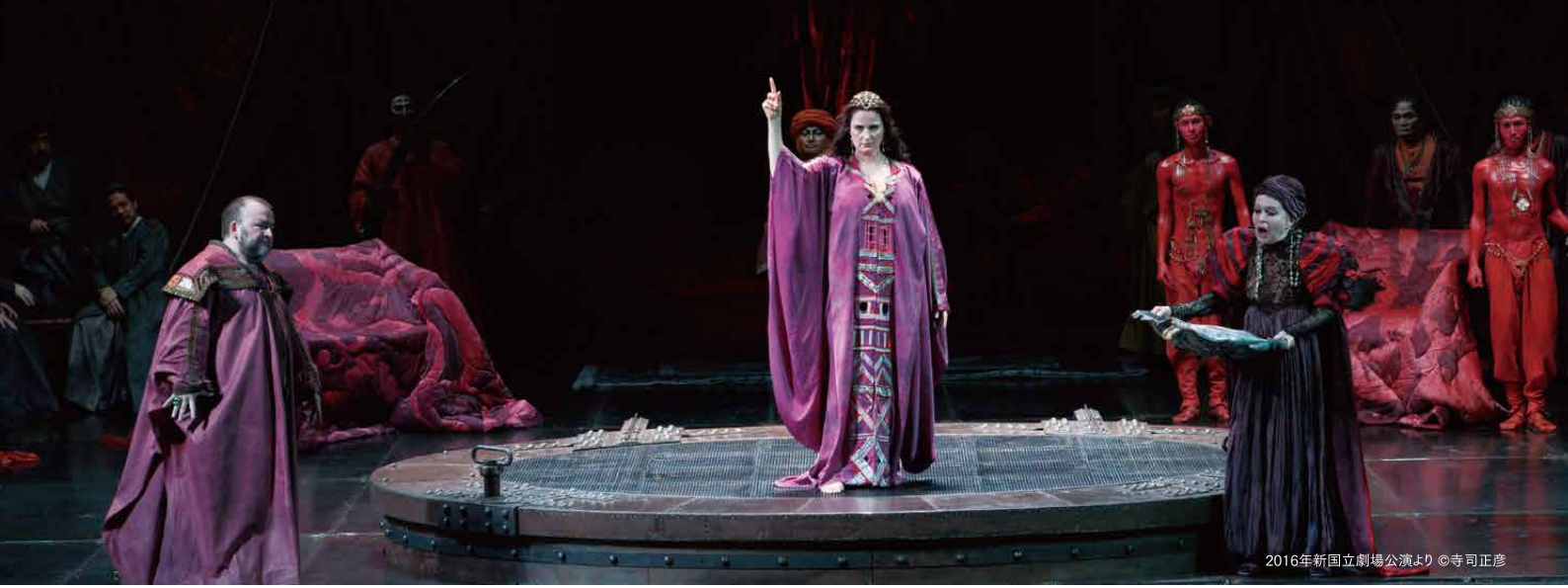
2016年新国立劇場公演より

後期ロマン派を代表する作曲家R. シュトラウスの衝撃的傑作。新約聖書の挿話をもとにしたオスカー・ワイルドの戯曲『サロメ』をR. シュトラウスが極彩色の音楽でオペラ化しました。その退廃的、耽美的な内容は初演されるや大反響を呼び、シュトラウスのオペラ出世となりました。全1幕の舞台に、豊かな旋律と大胆な不協和音が凝縮されており、緊張感に満ちた濃密なドラマには息をつく暇もありません。故エファディングによるプロダクションは舞台中央に巨大な古井戸を据えた迫力と妖しさ漂う秀作です。