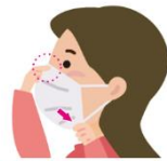
2あご下まで伸ばし顔に すき間なくフィットさせる