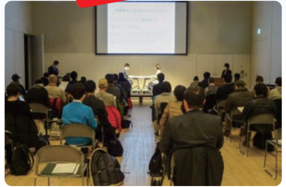
※昨年度のセミナーの様子