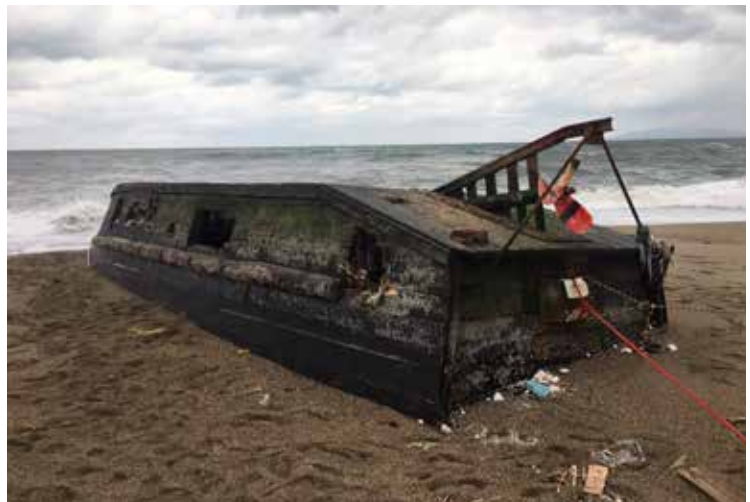
秋田県の海岸に漂着した木造船

札幌市営地下鉄東西線南北線東豊線 「大通」駅30番出口から西2丁目地下歩道より直結 徒歩約2分 さっぽろ地下街オーロラタウンから西2丁目地下歩道直結