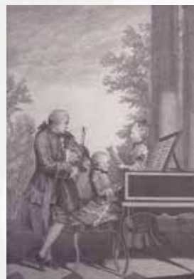
レオポルト・モーツァルトと子供たちとの肖像画

会場：SCARTSコート (札幌市民交流プラザ1階) 会期：2021年3月30日(火)～31日(水) 時間：11:00～14:45 / 15:40～18:45(30日) 11:00～14:45(31日) 入場無料