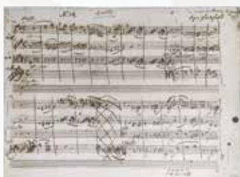
プロイセン王四重奏曲 二長調 K.575自筆譜