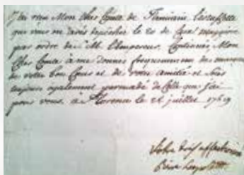
オーストリア帝国皇帝レーオポルト2世の自筆署名

※新型コロナウイルス感染拡大防止のため、開場時間や入場時の受付方法等が変更となる場合があります。 ※ご来場の際にはマスク着用、検温、手指の消毒など感染拡大防止にご協力をお願いいたします。