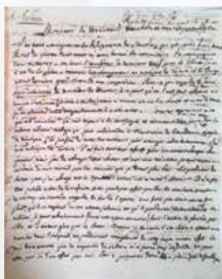
アントーニョ・サリエーリの自筆書簡