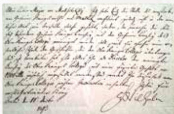
プロイセン国王フリードリッヒ・ヴィルヘルム2世の自筆署名