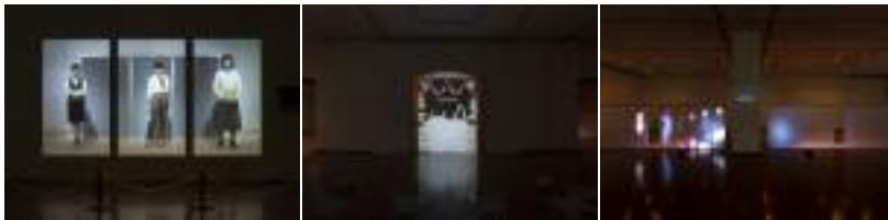
『渚・臉・カーテン』チェルフィッチュの〈映像演劇〉、2018年 熊本市現代美術館、Photo by Masaki Miyai

TOSHIKI Okada 岡田利規 1973年神奈川県生まれ。演劇作家、小説家、チェルフィッチュ主宰。2005年2月の5日間にて第49回岸田國士戯曲賞を受賞。2007年デビュー小説「わたしたちに許された特別な時間の終わり」を新潮社より発表し翌年第2回大江健三郎賞受賞。2012年より岸田國士戯曲賞の審査員を務める。2016年よりドイツ有数の公立劇場として知られるミッセン・カンマーシヤビルにて日本人演出家として初めて4シーズンに渡るレパートリー作品の演出を務めている。 (C) Kikuko Usuyama