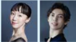
オーロウ姫 米沢 唯