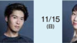
デジレ王子 福岡 雄大