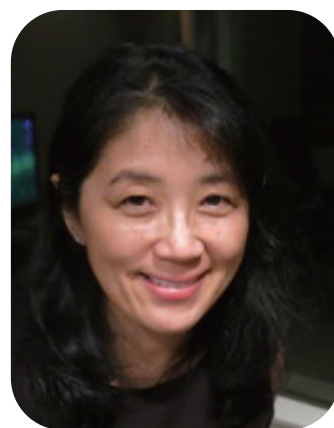
『未来をつくる図書館』(岩波新書) 著者 菅谷 明子氏