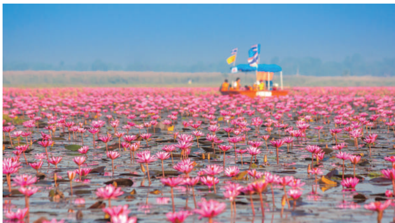
タイ北部のノンハン湖(新千歳発着としては初登場)

世界の名曲の歌声に聴き入り、旅情味わうひと時をお過ごしになりませんか? 秋から来春にかけての世界各地の旅を、幅広くご用意いたしました。映像をご覧いただきながら旅の魅力やポイントをご紹介します。当日は、下記の7コースの発表に加え、世界のお土産が当たるお楽しみ抽選会も行います。