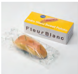
株式会社 四季舎 (苫小牧市) ほくほくスイーツポテト