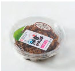
株式会社カネト水産 (古平町) たらこの佃煮