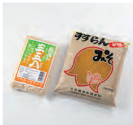
太田醸造有限公司 (訓子府町) すずらんみそ / 塩麹の素 三五八 (さごはち)