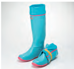
第一ゴム株式会社 (小樽市) 折り畳み長靴 パッカブル