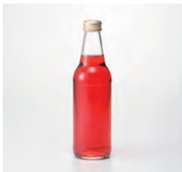
株式会社丸善市町 (苫小牧市) ハスカップの炭酸入り 焼耐用割材