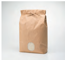
山本農園 (森町) ゆめびりか