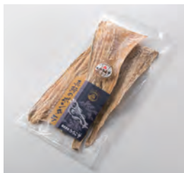
株式会社うろこ市 (稚内市) 真鱈のポンタラ