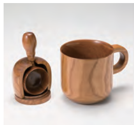
円鋳工芸舎 (美幌町) COFFEE SPOON & MUG