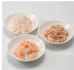
株式会社 Hokkaido Products (札幌市) シニア向けヘルスケアフード