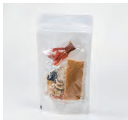
株式会社ショクラク (石狩市) 乾燥石狩鍋セット