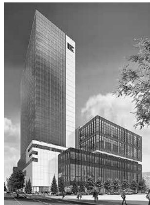
札幌市民交流プラザ(建物右側)外観

札幌市民交流プラザは、2018年10月、札幌都心に誕生する新しい施設です。札幌文化芸術劇場、札幌文化芸術交流センター、札幌市図書・情報館からなり、札幌における多様な文化芸術活動の中心的な拠点となることを目指します。隣接する高層棟には放送局やオフィスが入居するほか、地下には駐車場や公共駐輪場などが整備されます。詳しい情報は、札幌市民交流プラザHPをご覧ください。