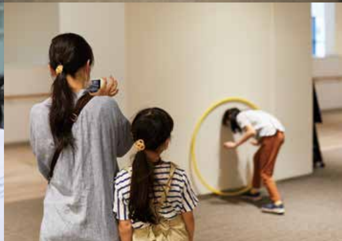
フラフープを小道具としてプラザ内の各所で参加者をコマ撮りし、1本のアニメーションを制作