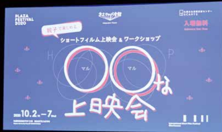
短編アニメーション『ヒップとベッシー・サーカスの巻』(1973年)、音響技術を取り上げた実写映画『ハイジ、耳をすませば。』(2016年)など、幅広く上映