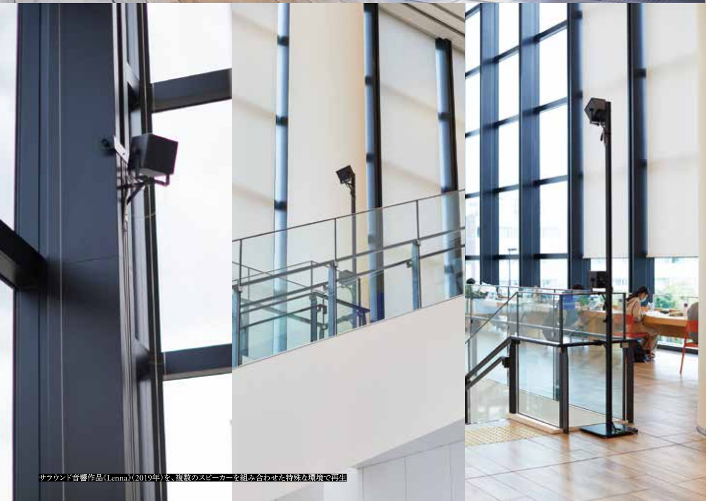
サラウンド音響作品(Lenna)(2019年)を、複数のスピーカーを組み合わせた特殊な環境で再生