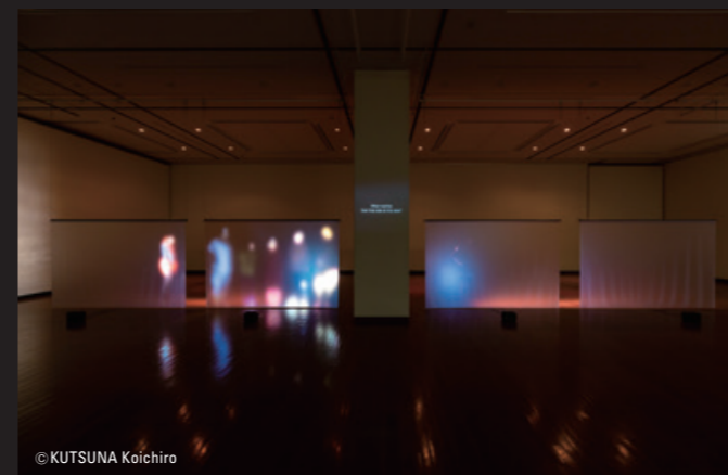
「The Fiction Over the Curtains」(2017-2018) 熊本市現代美術館「渚・臉・カーテン チェルフィッチュの〈映像演劇〉展」より ● 半透明のスクリーンに7人の人物が現れる群像劇。あたかもスクリーンの向こうに投影された人物たちの世界があるかのように感じられる。