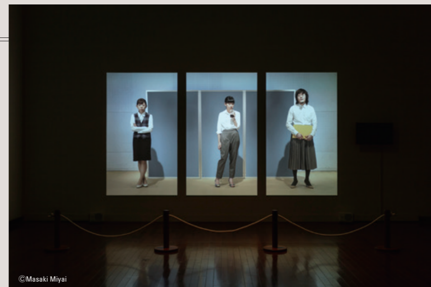
「働き者ではないっぽい3人のポートレート」(2017-2018) 熊本市現代美術館「渚・臉・カーテン チェルフィッチュの〈映像演劇〉展」より ● 3人の会社員らしき人物がポーズを決めている三連の絵画のようなしつらえて、三者三様に見る／見られることについておしゃべりを始める。